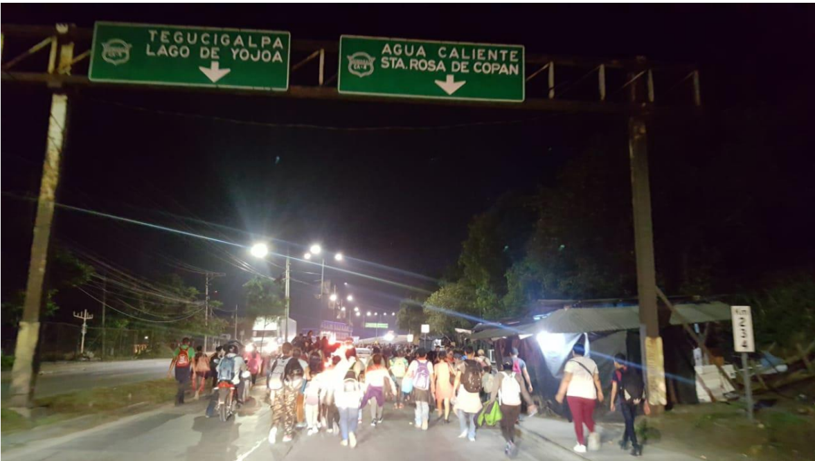
Caravana de migrantes Hondureños. Carretera a Copan, Honduras. 14 de enero 2020.