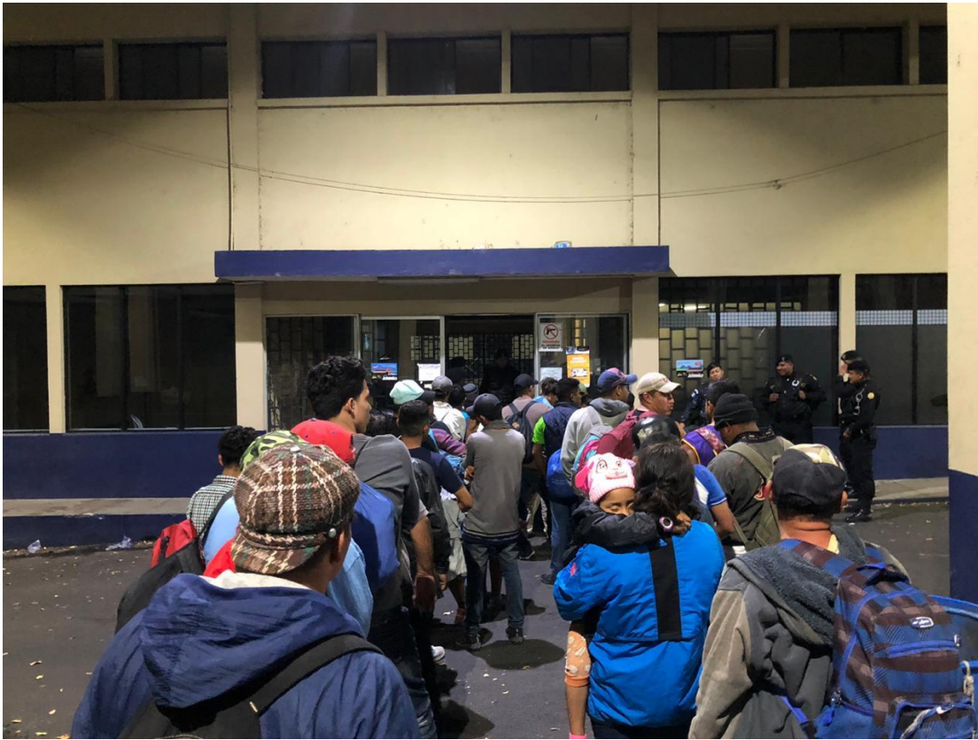
Albergue: Casa del Migrante, Esquipulas, Guatemala. 15 de enero de 2020