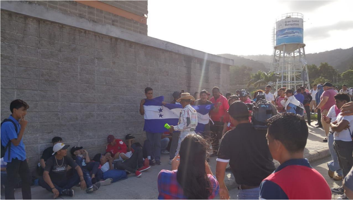
Terminal, San Pedro Sula, Tegucigalpa, Honduras. 14 de enero 2020